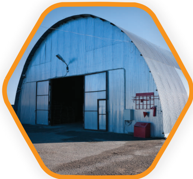
Теплоизоляция ангаров, промышленных сооружений