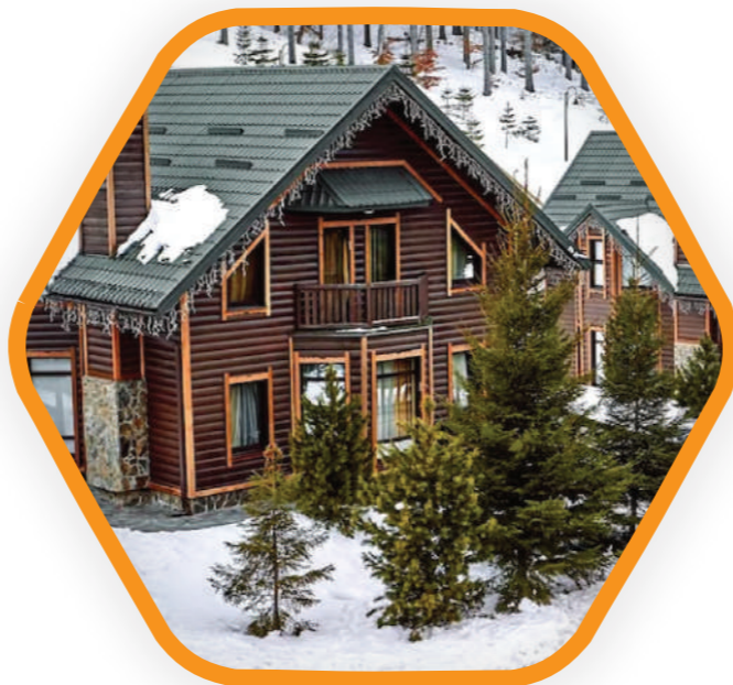
Теплоизоляция жилых домов, балконов, лоджий